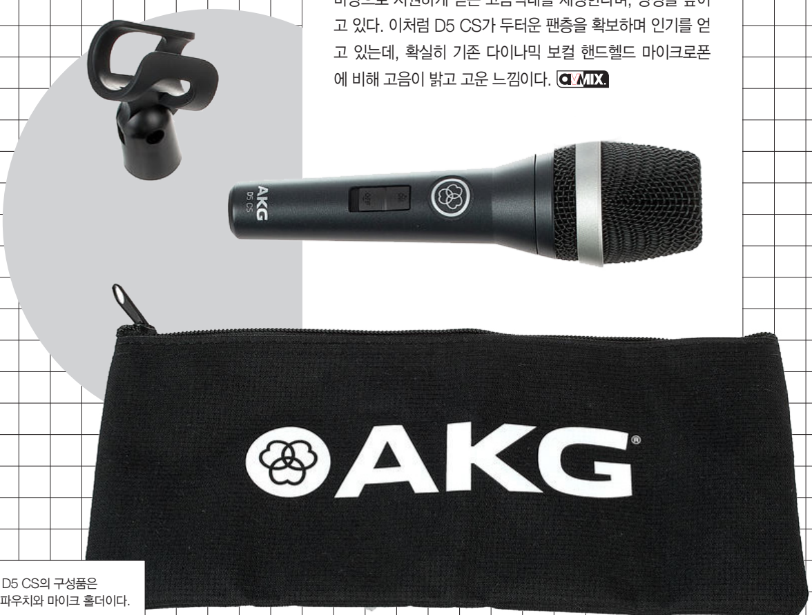
AKG D5 CS의 구성품은 마이크 보관 파우치와 마이크 홀더이다.

D5 CS는 이미 해외시장에서는 선명하고 투명한 사운드를 바탕으로 시원하게 뻗는 고음역대를 재생한다며, 명성을 높이고 있다. 이처럼 D5 CS가 두터운 팬층을 확보하며 인기를 얻고 있는데, 확실히 기존 다이내믹 보컬 핸드헬드 마이크로폰에 비해 고음이 밝고 고운 느낌이다. AMIX